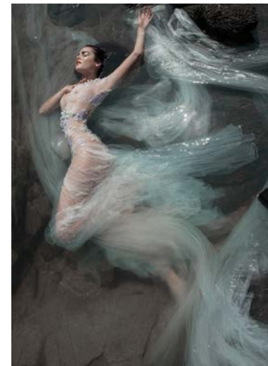
Venus In The Sunlight