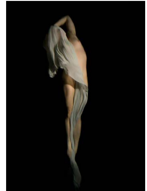
Christy Lee Rogers

En septembre 2017, Normal a offert la possibilité d'être publié(e) dans ses pages par le biais d'un concours photo, toujours en sublimant l'esthétisme du corps, mis à nu. Ce concours avait alors pour thématique : la Femme vue par la femme.